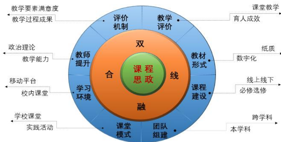
图：高职语文课程思政“三教”改革“双线融合”模式

1、在高职语文“课程思政”“三教”改革实践研究中探索“双线融合”模式，在研究要素课程建设、教材改革、教师团队组建、教师素养提升、评价机制、学习环境、课堂模式等方面探索“双线融合”模式，将现代职业教育的新思想、新理念贯穿于具体研究之中，积极适应职业教育供给侧改革要求，提高研究改革的系统性、全面性、实效性。